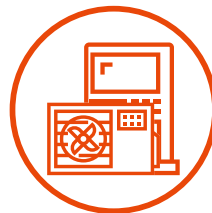
高効率給湯 (エコキュート等)