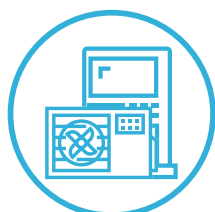
高効率給湯 (エコキュート等)