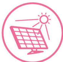
住宅用太陽光発電システム

スマートエネルギー住宅の普及促進するため、日本国内の住宅に本法人会員を通じ、スマートエネルギー設備を導入する方を対象に、スマートエネルギー住宅普及促進設備導入支援事業取扱要領に基づき、予算の範囲内で補助金を交付するものです。