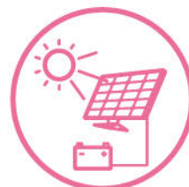
スマートエネルギーシステム